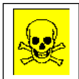
T+ sehr giftig

Pflanzenschutzmittel sind mit folgenden Gefahrensymbolen und Gefahrenbezeichnungen gekennzeichnet (schwarzer Aufdruck auf orangefarbenem Grund). Die für das jeweilige Präparat erforderlichen Schutzmaßnahmen sind der Gebrauchsanleitung zu entnehmen. Allgemeine Vorsichtsmaßnahmen beim Umgang mit Pflanzenschutzmitteln sind zu beachten.