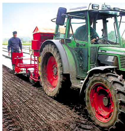
Die Ausbringung von Basamid Granulat erfolgt mit Spezialmaschinen. Bei dem abgebildeten Schlepperanbaugerät wird in einem Arbeitsgang das Granulat mit Schläuchen in den Boden ausgebracht, eingearbeitet und mit Folie bedeckt. Dadurch ist die Staubentwicklung bei der Ausbringung gering, der Anwender befindet sich in der Schlepperkabine in einem geschützten Raum.

tung mit ihren zahllosen Arten, Sorten und Kulturformen gehören auch Obstgehölze (Apfel, Birne, Kirsche, Pflaume, Himbeere, Brombeere und so weiter) sowie sehr viele Ziergehölze (unter anderem Zierkirsche, Mandelbäumchen, Kirschlorbeer, Spiere, Felsenbirne, Zierapfel, Zierjohannisbeere und so weiter) zu den Rosaceen, auf die keiner verzichten möchte und kann, der etwas auf seinen Garten hält. Insgesamt zählen zirka 70