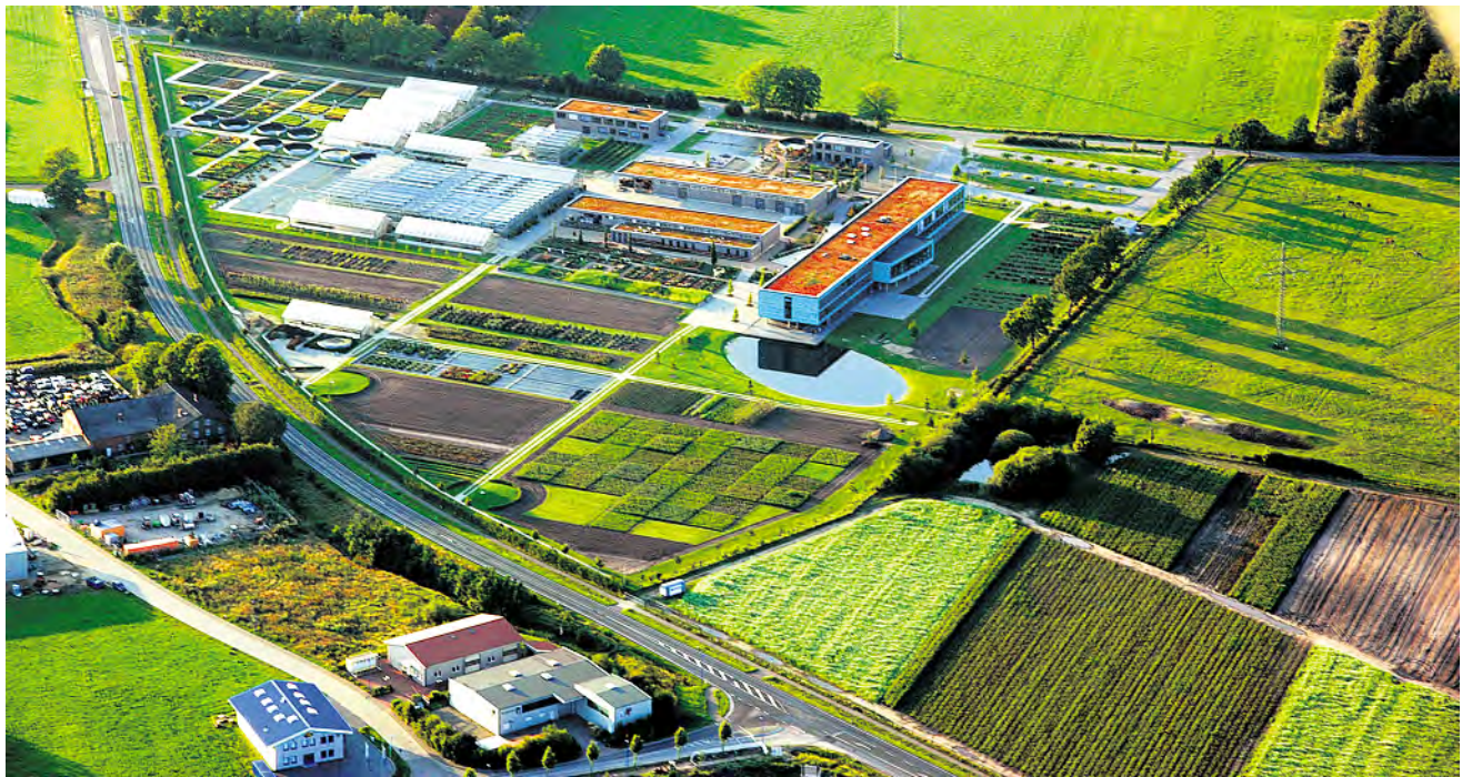
Gartenbauzentrum Schleswig-Holstein in Ellerhoop aus der Vogelperspektive. Im Vordergrund liegt die etwa 5.000 m 2 große Referenzfläche, auf der durch mehrmaligen Nachbau von fünf Rosenarten, Apfel, Birne, Kirsche und Spiere spezifische Bodenmüdigkeit von erheblichem Ausmaß induziert werden soll, um dann auf diesen Flächen gezielt nach der Ursache für die Bodenmüdigkeit suchen zu können.