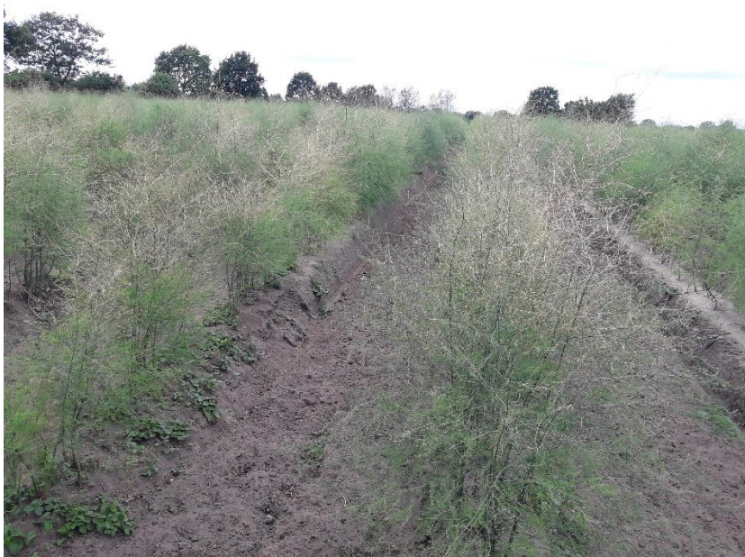
Schädigung einer Ertragsanlage durch das Spargelhähnchen

Adulte Tiere und Larven der zweiten Generation des Spargelhähnchens sind in einigen Regionen zum Teil stark in den Anlagen vertreten. Kontrollieren Sie Ihre Flächen auf Hähnchen und Fraßschäden und ergreifen ggf. Maßnahmen. Aktuell zugelassen sind Mospilan SG (0,325 kg/ha), Karate Zeon (0,075 l/ha), Lamdex Forte (0,15 kg/ha) sowie Neem-Azal-T/S (3 l/ha) und Spruzit Neu (12 l/ha).