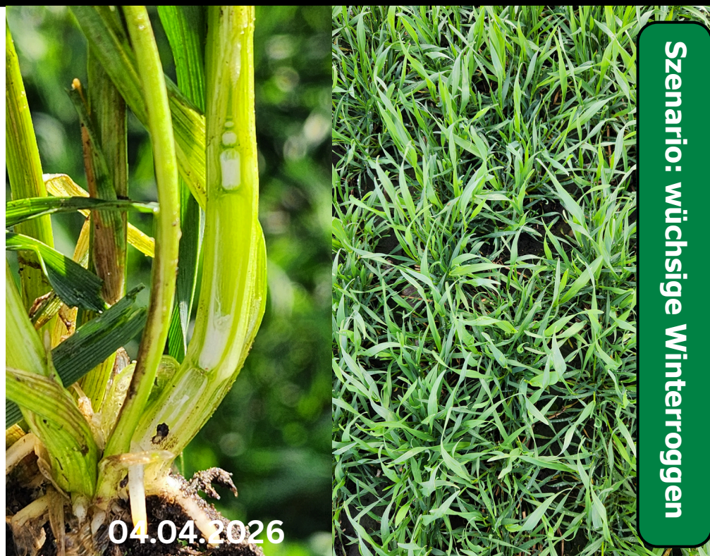
Szenario: wüchsige Winterroggen

Wichtig: Im Anschluss gilt es auf die weitere Wetterlage zu reagieren. Bei deutlich ansteigenden Temperaturen (über 18-20 °C mit viel Sonneneinstrahlung) und Niederschlägen gilt es unabhängig vom Entwicklungsstadium auf intensive Wachstumsschübe des Roggens durch zeitnahe Nachkürzungen zu reagieren.