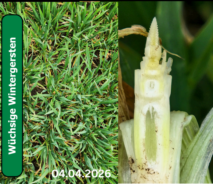
Szenario: Wüchsige Wintergersten