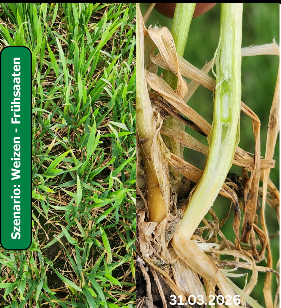
Szenario: Weizen - Frühsaaten