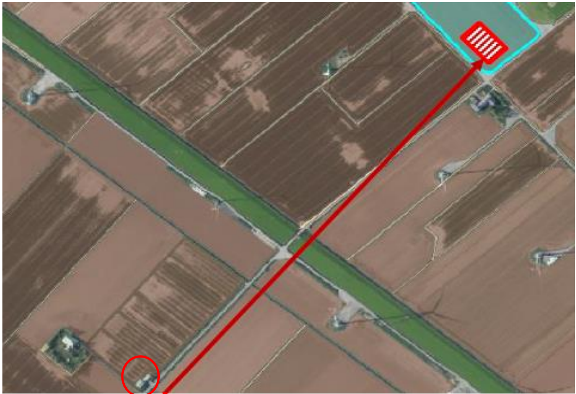
Lage der Versuche auf der Praxisfläche Standort der Versuchsstation Sönke-Nissen-Koog