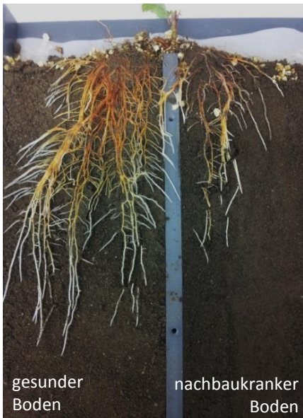
gesunder Boden nachbaukranker Boden

Das ORDIAmur-Vorhaben untersucht die Nachbaukrankheit bei Apfel. Die 15 Projekte (s. Rückseite) sind in fünf Arbeitspakete (WP) strukturiert (Abb. 1). Das vorrangige Ziel des Verbundes ist es, nachhaltige Ansätze zur Überwindung der Nachbaukrankheit zu entwickeln.