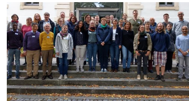
Verbundtreffen von ORDIAmur, Dresden (18-09-2019)