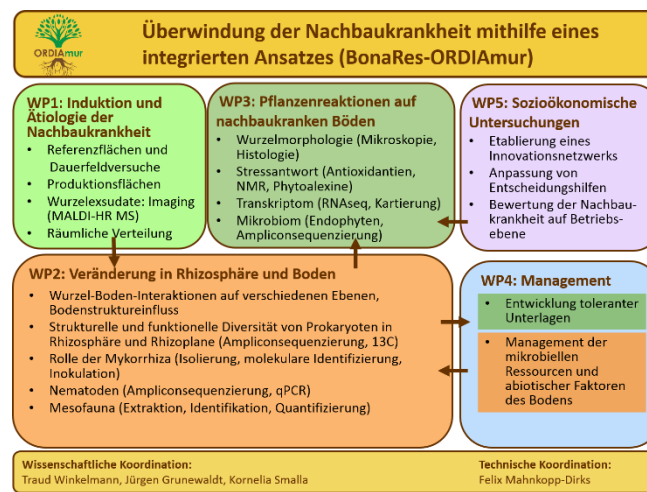
Abb. 1: Struktur des ORDIAmur-Verbundes