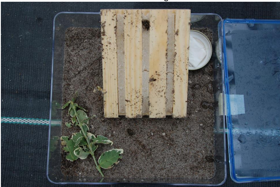
Abb. 2: Als Versuchsarena dienten Frischhalteboxen (20 x 20 x 8 cm), in denen eine ca. 0,5 cm mächtige Schicht aus einem Torf-Sand-Gemisch (v:v = 1:1) enthalten war, ein Zweig von Euonymus fortunei als Futterpflanze und eine kleine Schale ( \varnothing = 4 cm) mit Wasser. In die Boxen wurden jeweils drei Käfer gesetzt. 24 h danach wurden die Holzbretter (13 x 9,5 x 1,5 cm) ausgelegt, auf deren Unterseiten ein Spezialgel mit Steinernema carpocapsae aufgetragen war