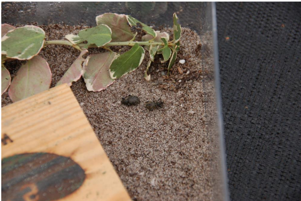
Abb. 4: Genau wie diese zwei Käfer waren zum Versuchsende in den vier Behandlungen mit dem Spezialgel, das den Nematoden Steinernema carpocapsae enthielt, alle Käfer des Kompakten Dickmaulrüsslers tot