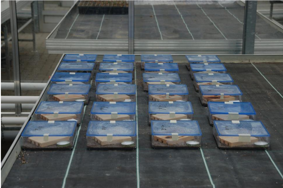
Abb. 1: Versuchsanordnung zur Bekämpfung u.a. von Käfern des Kompakten Dickmaulrüsslers mit Hilfe des insektenpathogenen Nematoden Steinernema carpocapsae auf einem Gewächshaustisch im Gartenbauzentrum der Landwirtschaftskammer Schleswig-Holstein