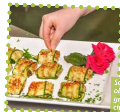
Sorgfältig und genau zu arbeiten, hat oberste Priorität. Auch die Hygiene wird großgeschrieben. Nagellack oder künstliche Fingernägel sind in der Küche tabu.