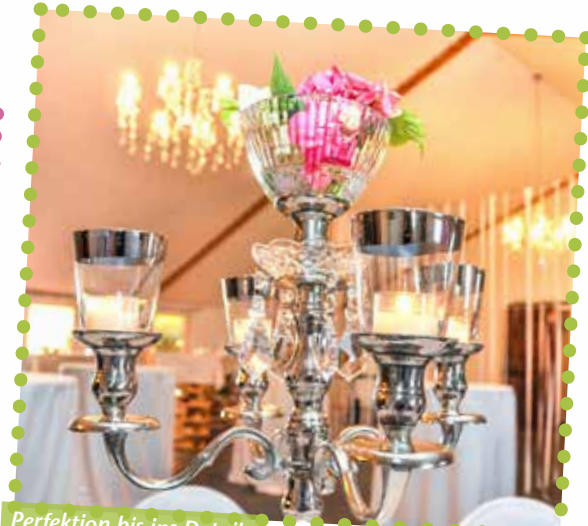
Perfektion bis ins Detail in der „Kuh-Lounge“.

spricht. Vielseitig und modern sei dieser. Im Zeitalter von Ernährungstrends, der Suche nach allergiefreien Gerichten oder vegetarischen Buffets gebe es viele Möglichkeiten. Das erlebe sie auch auf den Messen wie der Internorga. Inspiration holt sich die Unter-