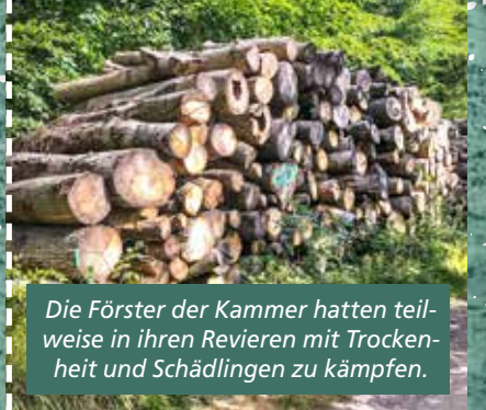
Die Förster der Kammer hatten teilweise in ihren Revieren mit Trockenheit und Schädlingen zu kämpfen.