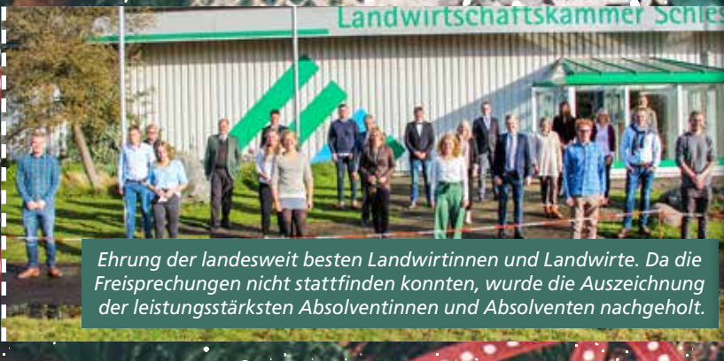
Ehrung der landesweit besten Landwirtinnen und Landwirte. Da die Freisprechungen nicht stattfinden konnten, wurde die Auszeichnung der leistungsstärksten Absolventinnen und Absolventen nachgeholt.