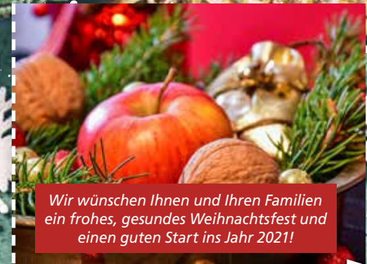
Wir wünschen Ihnen und Ihren Familien ein frohes, gesundes Weihnachtsfest und einen guten Start ins Jahr 2021!