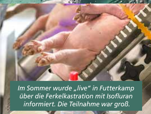
Im Sommer wurde „live“ in Futterkamp über die Ferkelkastration mit Isofluran informiert. Die Teilnahme war groß.