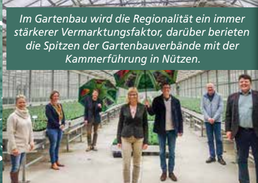
Im Gartenbau wird die Regionalität ein immer stärkerer Vermarktungsfaktor, darüber berieten die Spitzen der Gartenbauverbände mit der Kammerführung in Nützen.