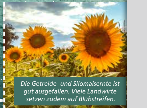
Die Getreide- und Silomaisernnte ist gut ausgefallen. Viele Landwirte setzen zudem auf Blühstreifen.