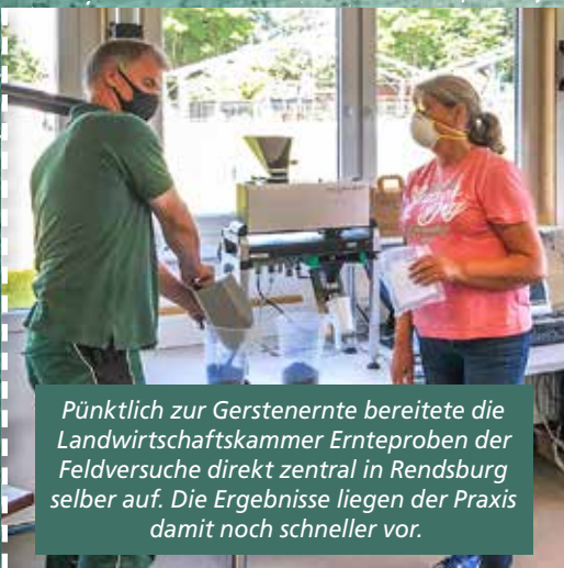
Pünktlich zur Gerstenernte bereitete die Landwirtschaftskammer Ernteproben der Feldversuche direkt zentral in Rendsburg selber auf. Die Ergebnisse liegen der Praxis damit noch schneller vor.