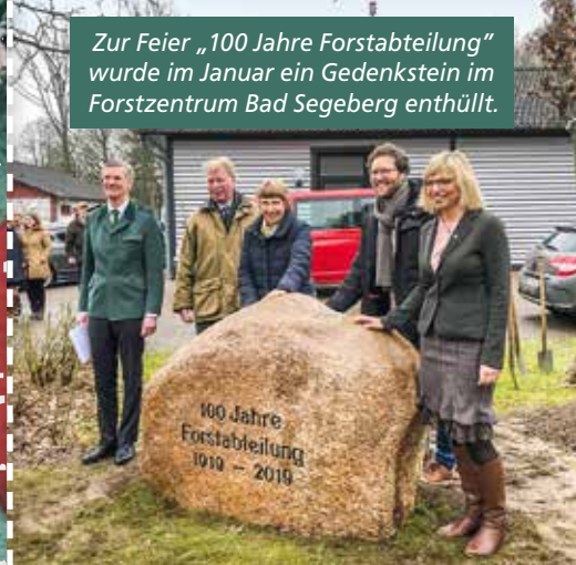
Zur Feier „100 Jahre Forstabteilung“ wurde im Januar ein Gedenkstein im Forstzentrum Bad Segeberg enthüllt.