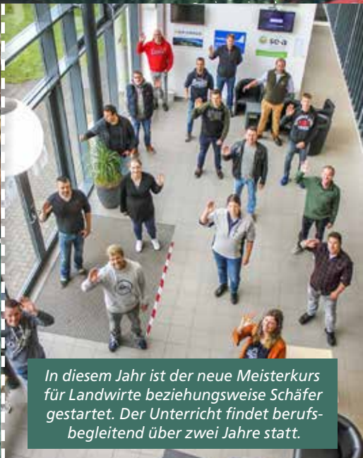
In diesem Jahr ist der neue Meisterkurs für Landwirte beziehungsweise Schäfer gestartet. Der Unterricht findet berufsbegleitend über zwei Jahre statt.