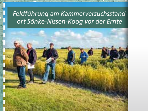
Feldführung am Kammerversuchsstandort Sönke-Nissen-Koog vor der Ernte