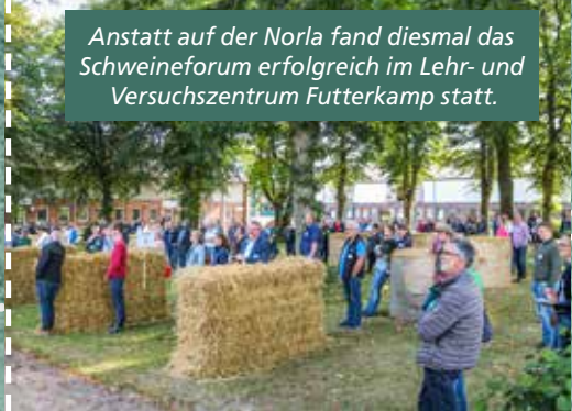
Anstatt auf der Norla fand diesmal das Schweineforum erfolgreich im Lehr- und Versuchszentrum Futterkamp statt.